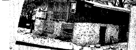
Das Haus der spanischen Tänzerin im Jahre 1994: Völlig heruntergekommen und über und über voll mit Müll war es. Heute ist es wieder original wiederhergestellt - sogar im Inneren.