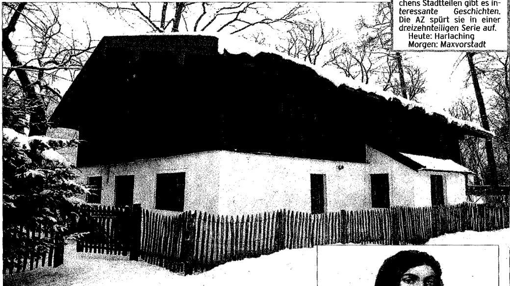
Das Lola Montez-Haus in der Mengerschwaige: Heute schaut die alte Schmiede wieder aus wie damals im 19. Jahrhundert.