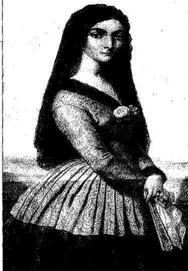
Ein von Bildnis Lola Montez, die hier mit einem spanischen Tanzkostüm bekleidet ist.

die 50 Hochzeiten wurden im ehemaligen Liebesnest bereits zelebriert. Nina Ruge feierte hier ihren Geburtstag und „erfüllte sich damit einen Traum“. Mit ihrer Begeisterung ist sie nicht allein. Besucher Peter Ustinov sagte: „Die Geschichte des Hauses wirkt wie ein Jungquell. Ein Königreich für diese Frau.“